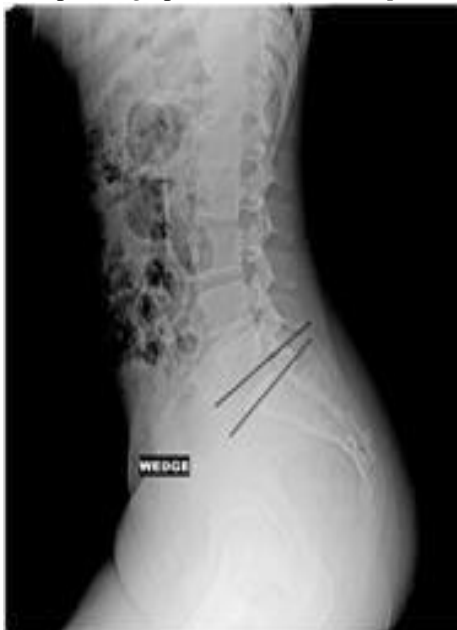
Gambar 4 Contoh hasil radiograf vertebra pada pemeriksaan lumbosacral dengan proyeksi lateral menggunakan wedge pada kasus low back pain

Pada pemeriksaan lumbosacral dengan proyeksi lateral pada kasus low back pain dapat menampakkan anatomi foramen intervertebralis L1-L4, corpus vertebra, space intervertebra, processus spinosus, L5-S1 . Dari hasil penilaian check list oleh responden menunjukkan hasil yang jelas letak perbedaan antara radiograf lumbosacral dengan proyeksi