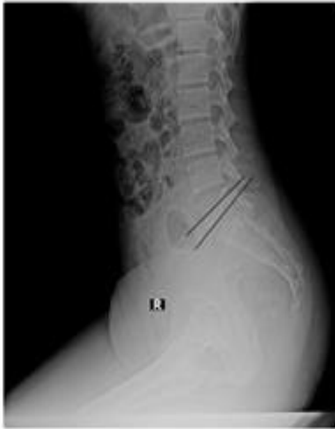
Gambar 3 Contoh hasil radiograf vertebra pada pemeriksaan lumbosacral dengan proyeksi lateral tanpa wedge pada kasus low back pain

wedge lebih besar dari pada pemeriksaan lumbosacra lateral tanpa wedge.